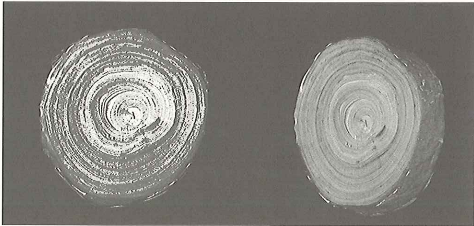
図5-3 磁器共鳴イメージング画像

また、遺跡などから出土するスギ材は、遺存状態が良好な場合が多いが、三瓶小豆原理没林の立木の場合、心材に加えて辺材と樹皮が存在しており、その劣化状態も様々である。図5-3はスギ立木(A-9)の発掘調査にともなって出土したスギ小径木の磁器共鳴イメージング(MRI)の画像である。MRIでは、木材内部の水分の分布を断層写真として画像化することが可能であるため、出土木材の劣化状態を非破壊で把握することのできる方法である。スギ材の場合、辺材の劣化が著しく心材の残りがよいのが一般的であるが、このスギ小径木の場合、内部の心材において水分量が高い部位が存在すること、ならびに亀裂も存在していることが明らかである。保存処理を行なおうとしているスギ立木の巨大さを考えると、この劣化状態の不均一さが大きな問題となってくるであろう。