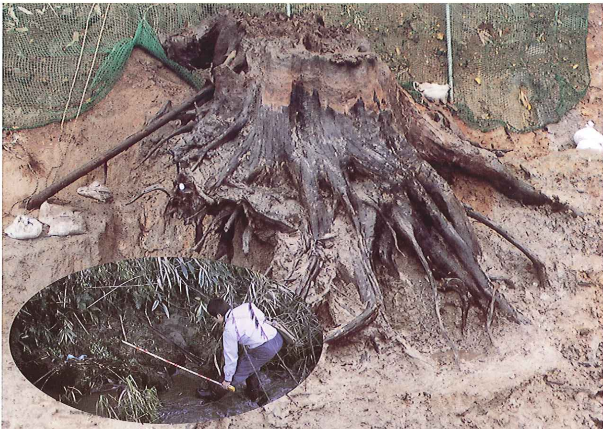
掘り出された根株 (A-10)。小豆原川の河床に以前から露出していた。