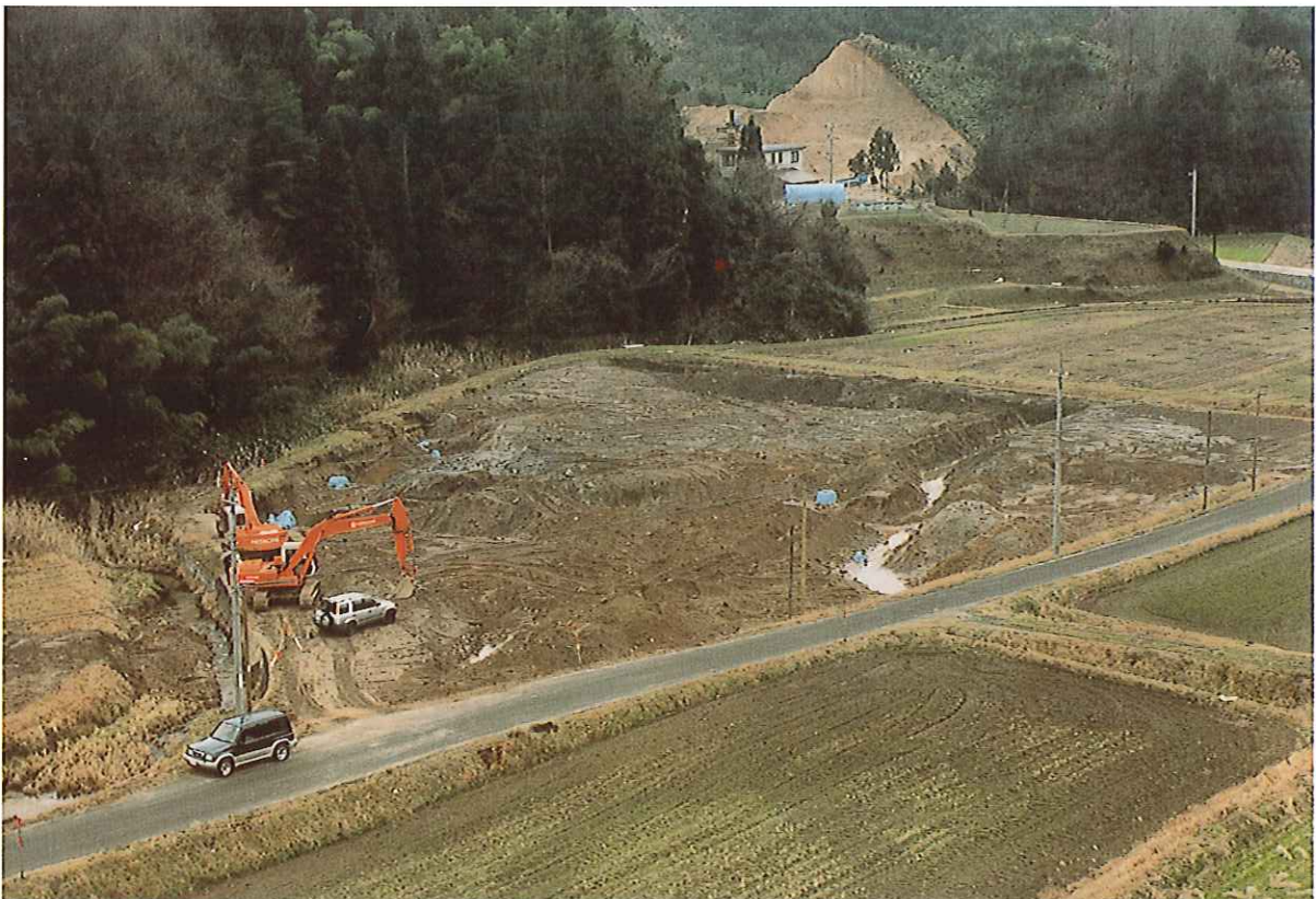
掘り出し調査区全景