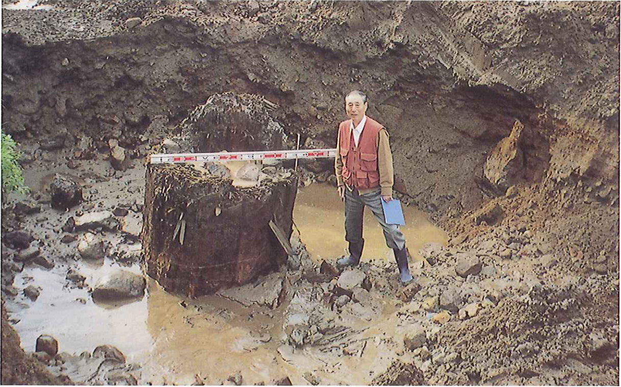
最初に発見した埋没木 (A-1)