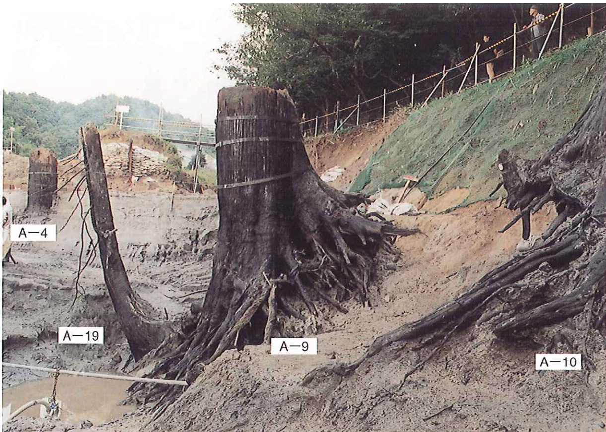
地層調査に伴い掘り出された埋没林