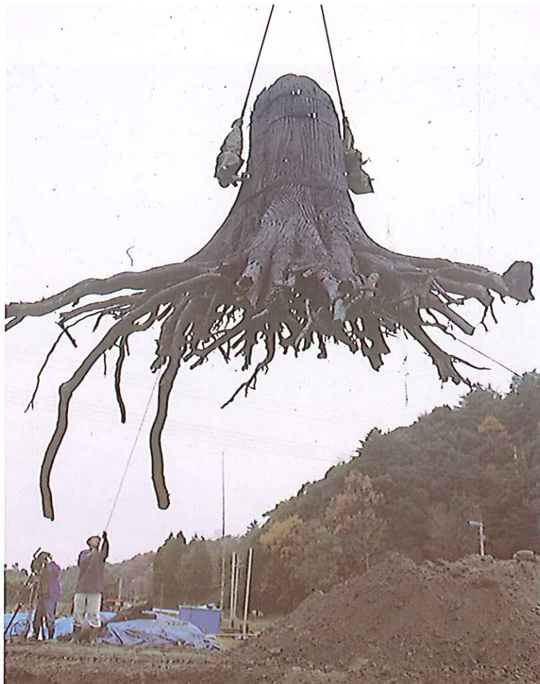
保存処理のため 搬送中のA-9