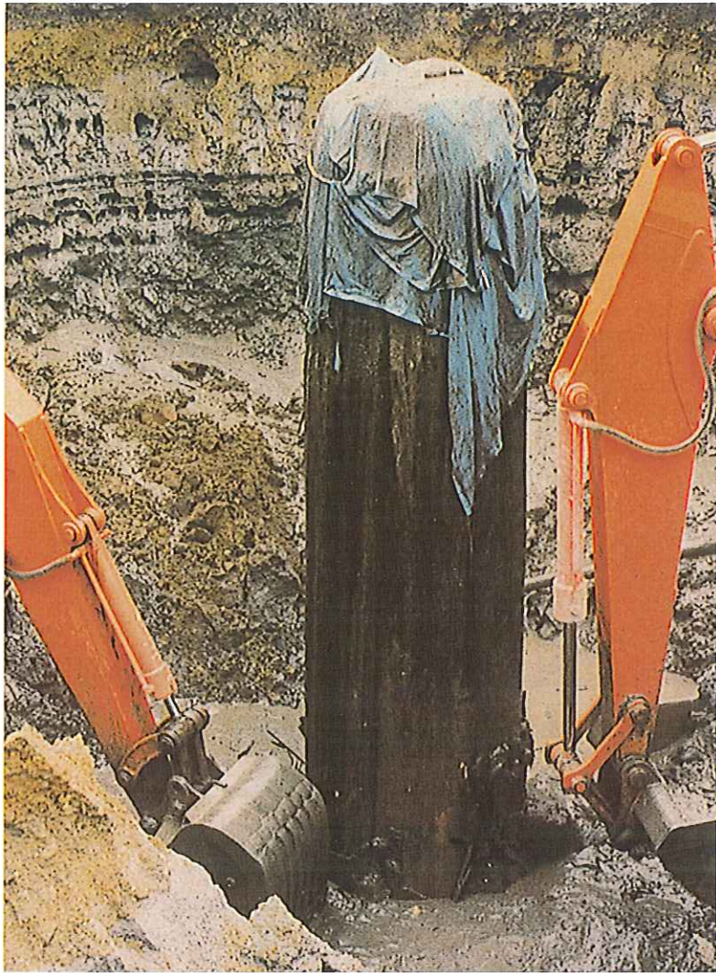
昭和58年に掘り出された 埋没木 (A-13)